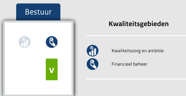
Oordelen op bestuursniveau voor de gebieden Kwaliteitszorg en ambitie en Financieel beheer

In de tweede figuur is weergegeven in hoeverre onze oordelen op de onderzochte standaarden overeenkomen met het beeld dat het bestuur zelf heeft van de gerealiseerde kwaliteit op de scholen en in hoeverre het beleid van het bestuur doorwerkt tot op schoolniveau.